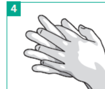
4 Handfläche auf Handfläche mit verschränkten, gespreizten Fingern