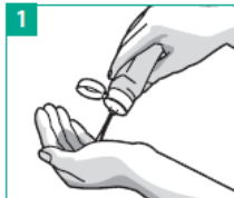
1 Desinfektionsmittel in die trockene Hohlhand geben

Führen sie VOR und NACH dem Patientenbesuch eine gründliche Händedesinfektion durch: