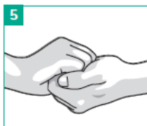
5 Aussenseite der Finger auf gegenüberliegende Handflächen mit verschränkten Fingern