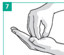
7 Kreisendes Reiben der geschlossenen Fingerkuppen in der Handfläche, beidseitig