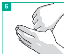
6 Kreisendes Reiben der Daumen in der geschlossenen Handfläche