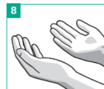
8 Nach 15 - 30 Sek. Einreiben sind Ihre Hände trocken und bereit zum Einsatz

Stellen Sie sicher, dass ein Abstand von 1.5 Metern zwischen 2 Personen eingehalten wird. Bestätigen Sie , dass Sie aktuell KEINE von den aufgeführten Symptomen/Beschwerden bei sich selber feststellen: