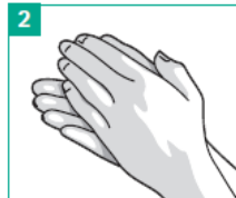
2 Handfläche gegen Handfläche reiben